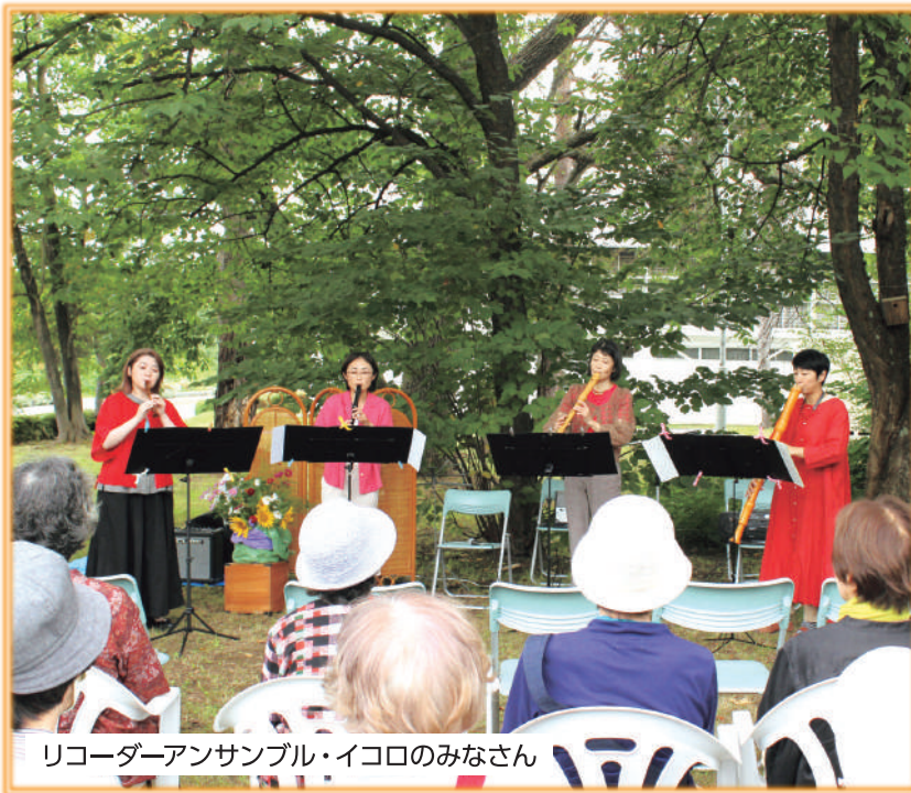
リコーダーアンサンブル・イコロのみなさん