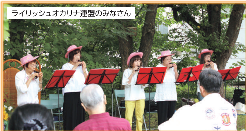
ライリッシュオカリナ連盟のみなさん

ぼだい樹農園でのコンサートは第11回目となりました。木陰で聴くギター、リコーダー、オカリナの音色に癒されました。