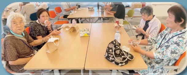
今日の昼食はちゃみせさんのおむすび

これから3ヶ月何をするか？チームのみんなで決めました。美味しいもの食べに行きたい！身体を動かしたい！とみなさんやりたい事がたくさんあって、久しぶりに会えた方と楽しくお話ししていたり、一緒におむすびを食べて、笑顔いっぱい楽しい時間でした！参加していただいたみなさん、これからどうぞよろしくお願いいたします！